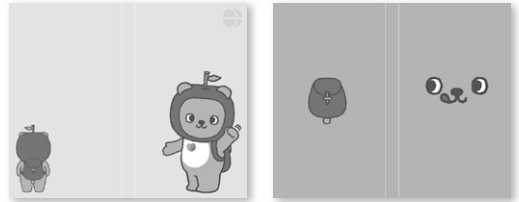
透明ビニール製カバー + 両面デザイン台紙