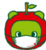
長野県PRキャラクター 「アルクマ」 ©長野県アルクマ