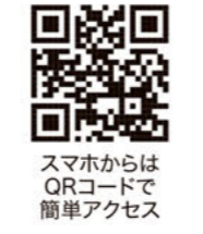
スマホからはQRコードで簡単アクセス

●お問い合わせは 事務局：箕輪町教育委員会 文化スポーツ課 TEL. 0265-70-6601 〒399-4601 長野県上伊那郡箕輪町中箕輪10291