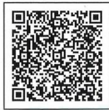
企業/グループ用 認証コード