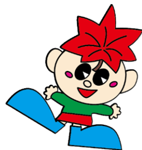
箕輪町PRキャラクター もみじちゃん

令和4年 10月1日（土）～10月12日（水） ※土日・祝日は休業 ※受付時間外の申出は、翌営業日に対応いたします。