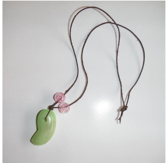
勾玉 (左 セット/右 完成イメージ)