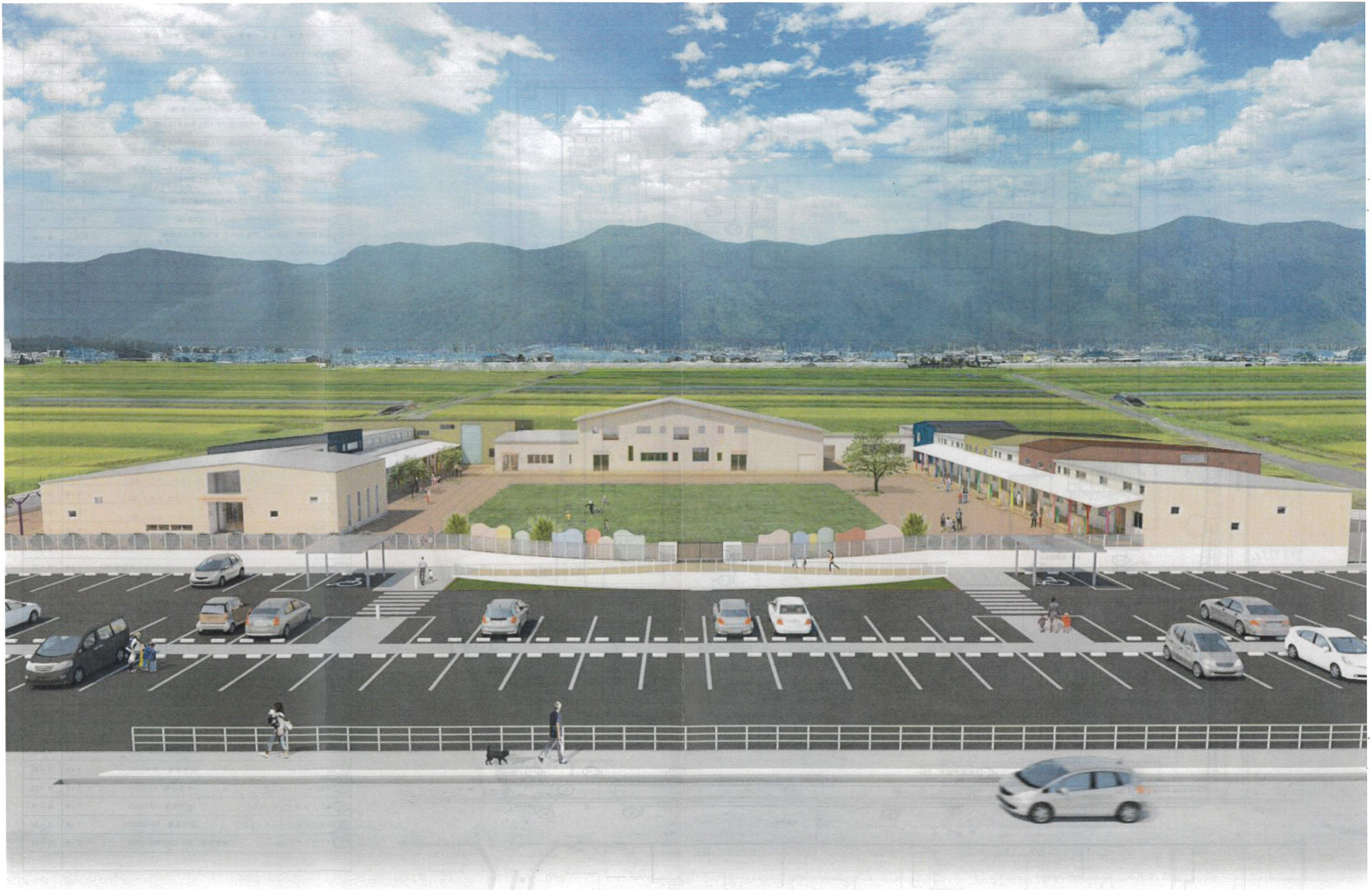
木下保育園建設事業 完成予想図