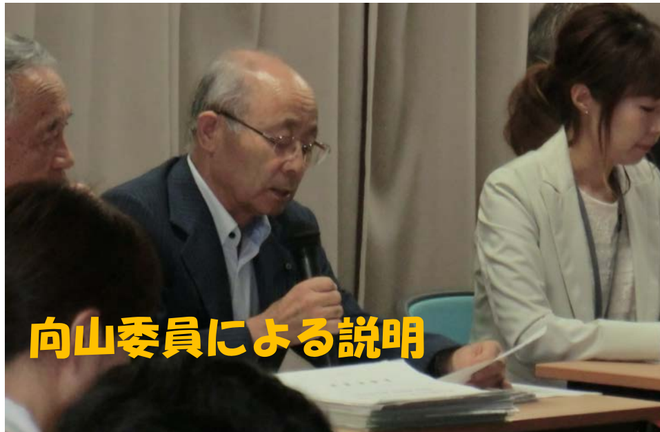
向山委員による説明

なり手(人材)不足問題について、特に当町の特色として自動化出来ない仕事が多く、専門的な技術者が不足しており、人材が確保できれば良いという問題ではない状況である。