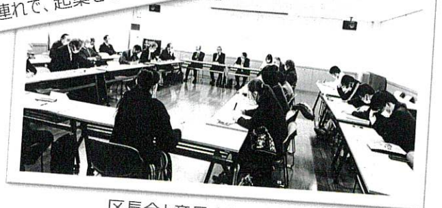
区長会と意見交換をした時の様子