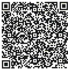
応募用 QR コード