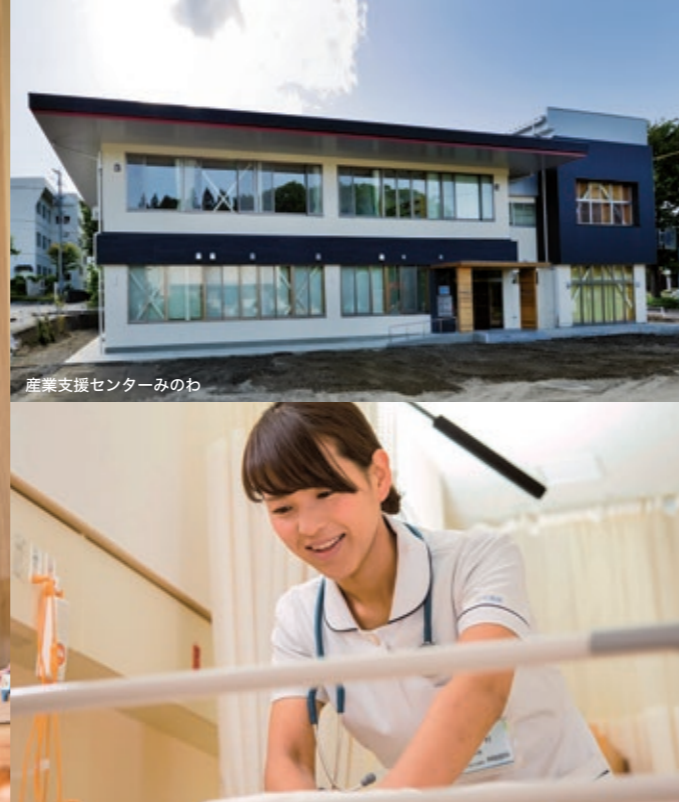
産業支援センターみのわ

農業では、2つのアルプ스에 困まれ、台風などの災害が少なく、農業に適した気候といえます。くだものや野菜の栽培が盛んで、JAの新規就農者の受け入れも行っていきます。