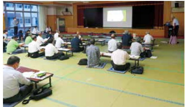
松島区地区懇談会