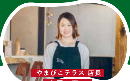
やまびこテラス 店長