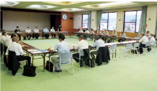
木下区地区懇談会