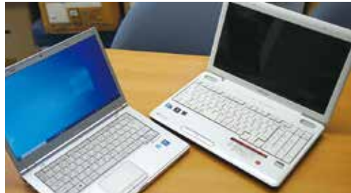
リサイクルされたパソコン