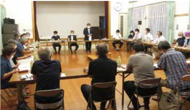
下古田区地区懇談会

質疑内容については、町内15区合わせて170項目にのぼり、特に「道路・交通安全」、「消防・防災」、「人口・移住定住」が主要なテーマとして挙げられ、近年多発する災害対策に関する内容や今年起きた痛ましい交通事故などを教訓とした内容など、各区で質疑が行われました。