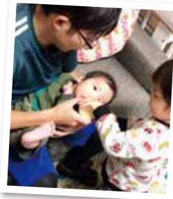
※写真は過去のフォトコンテスト応募作品より

まだ子供が小さくて、長時間離れることはできません。時々、短時間で買い物へ行く程度です。しっかりと自分の時間も持てるよう、家族として家事育児に参加していきたいですね。