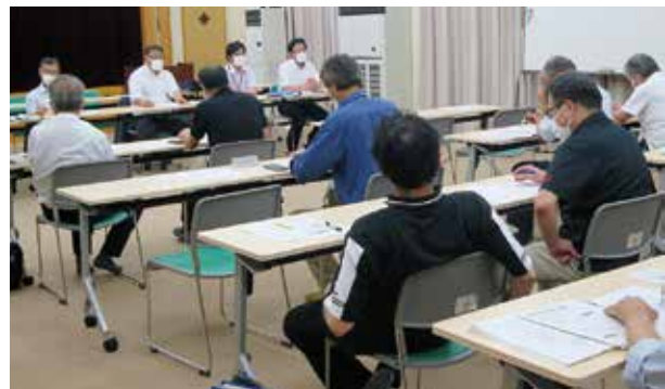
福与区地区懇談会