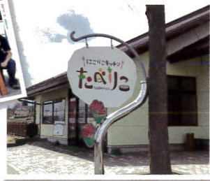
ワークショップで作った サイクルスタンドを お披露目します。