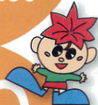
箕輪町イメージ キャラクター 「もみじちゃん」