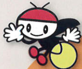
辰野町イメージ キャラクター 「びっかりちゃん」