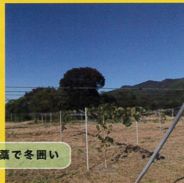
近所の農家さんからいただいた葉で冬囲い