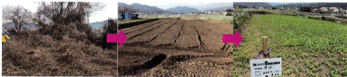
荒廃農地の解消・復旧事例 (令和 2 年、大出地区)

8 月に町内一斉農地パトロールを実施いたします。荒廃農地を発生させないよう、農家の皆様には、引き続き、農地の保全管理に努めていただくよう、よろしくお願いいたします。また、不適切な利用 (違法転用) はおやめください。