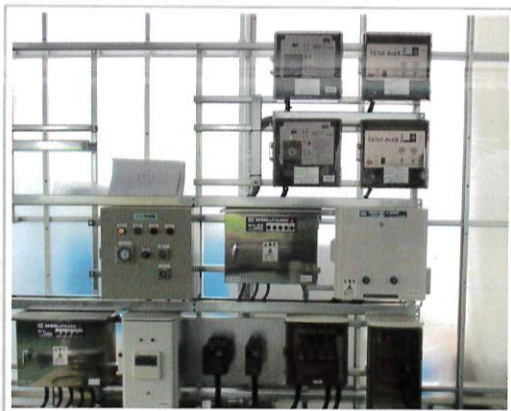
散水・検温・窓開閉などをスマホから制御するシステムも自作