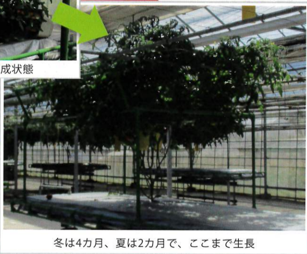
冬は4カ月、夏は2カ月で、ここまで生長