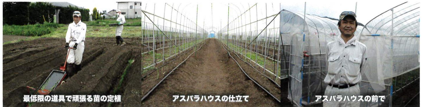
最低限の道具で頑張る苗の定植