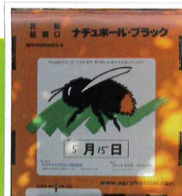
受粉担当は クロマルハナバチ