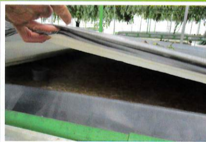
ベッドには白根が密集