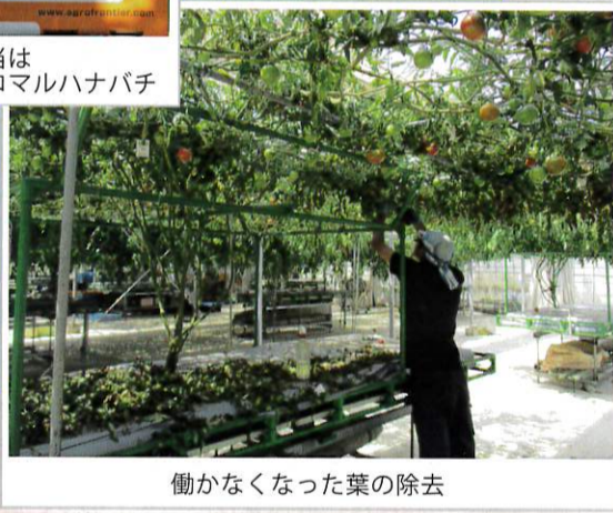
働かなくなった葉の除去