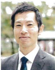
松井サービスコンサルティング 代表