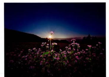
特選「ルビーの輝き（里の夜明け）」