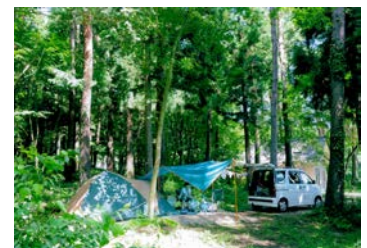
推薦「新生オートキャンプ場」