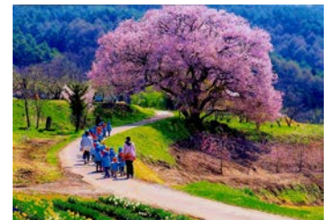
推薦「おさんぽ日和」