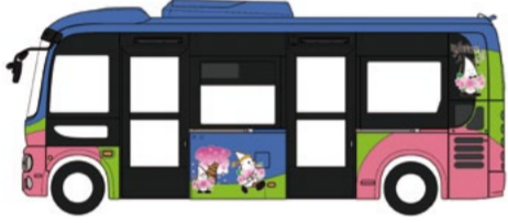
伊那市街地循環バス