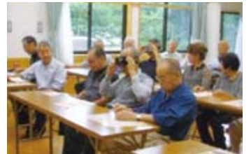
下古田長寿クラブ交通安全教室