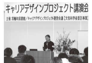
昨年の講演会の様子

仕事を含め、様々な人生設計(キャリアデザイン)について基本を学ぶ講演会等を開催します。