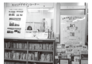
図書館の特設コーナー