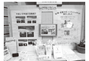
物産展でのPRの様子

町商工会・地域企業と連携して、企業の持つ技術・商品をPRするための展示を箕輪進修高校文化祭で行い、地元就職のための情報提供の場をつくりました。