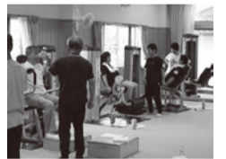
トレーニングの様子

入学を希望される方は、下記にお電話いただくか、はがき、またはFAXに、氏名、生年月日、性別、希望トレーニング曜日(月・火・水・木から第1希望、第2希望)、住所、電話番号を明記の上、2月21日(木)までにお申込みください