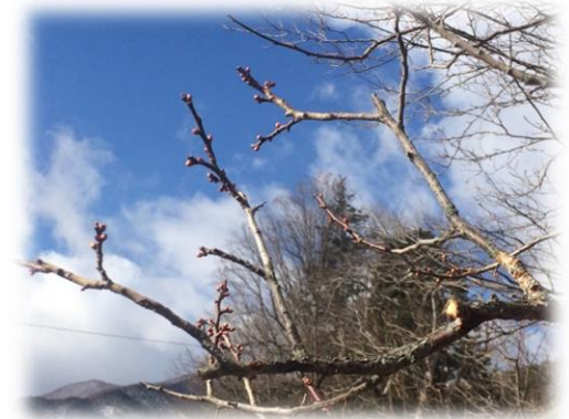
青空の下膨らむ梅のつぼみ