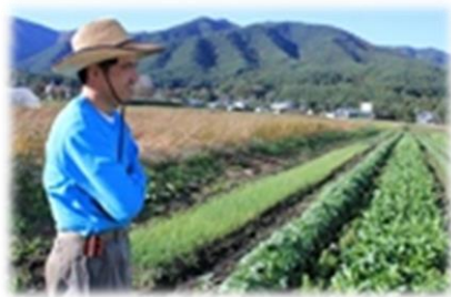
インタビューさせていただいた町の企業家の方や農家さん