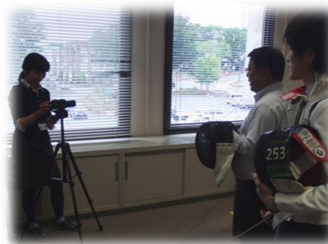
町長のフェンシング映像を撮影

そしてなんと、町長のフェンシング映像を撮影させていただきました。こちらは東京の移住相談会で、PR用に作成したものです。こんな気さくな町長のいるみのわ町はいいところだな、と再確認しました。動画は「みのわの魅力発信室」のFacebookにアップしてあります！ぜひご覧ください。