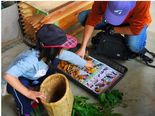
＜写真は今年の秋の講座の様子＞

そろそろキノコも顔を出し始める頃です。安心して、キノコ採取が出来るように毒キノコを中心とした座学と、実際にキノコを探しに外に出ます。