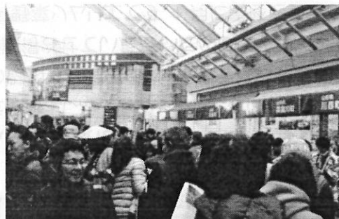
左：物販ブースでのジャムの販売 上：物販会場にあふれる人！