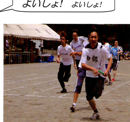
よいしょ! よいしょ!