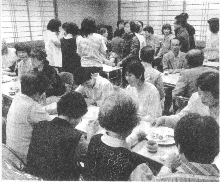
参加者が多く賑やかな茶話会になりました。

恒例のお茶会の時は、先生方と一緒に、毎回来て下さる方、手話の出来る方、様々な方と楽しくお話が出来ました。次回は11月17日(木)の予定です。