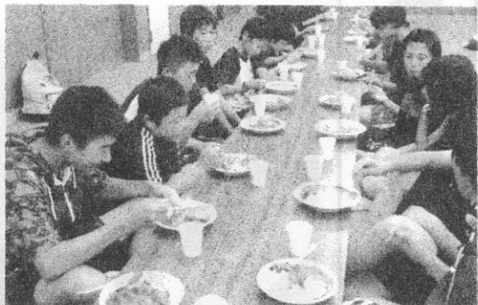
カレーに夢中です

練習開始から2週間が過ぎた9月3日、中間慰勞会が行われました。まだ昼間の暑さが残る夕方5時、まずは各自の練習成果をみるため記録会を行い、その後、役員が心を込めて作ったカレーをみんなで食べました。野菜がたっぷり入ったカレーに、チキンカツを添えてボリュームアップ! お釜が空になるくらいたくさん食べてくれました。本番まで残り1週間あまり。この勢いで21連覇目指し、一致団結して頑張りましょう!