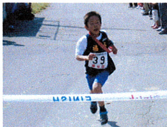
福与B 東コース 31位