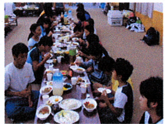
カレーライス美味しいね