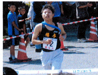
福与A 西コース 9位