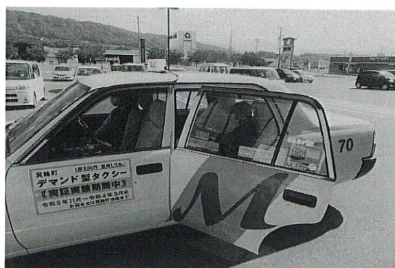
デマンド型タクシー実証実験