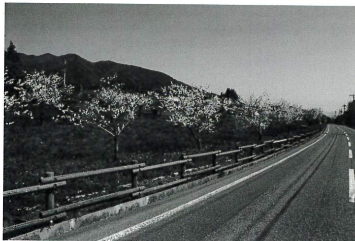
花もも街道（県道与地・辰野線の一部）

箕輪町は、平成27年（2015年）に箕輪町景観条例を制定し、景観行政団体 *2 に移行しました。町の景観を守るためには一定の計画と規制が必要であり、条例で規定された届出について適正に審査していきます。また、計画と規制について住民に周知し、意識を高めるとともに、景観整備を行い、良好な景観をつくる活動に取り組みます。