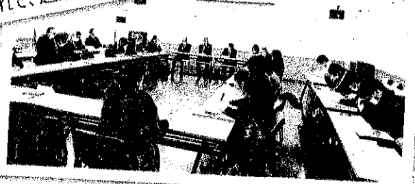
区長会と意見交換をした時の様子