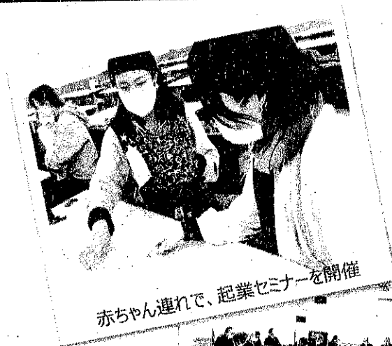
赤ちゃん連れて、起業セミナーを開催