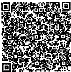
応募用 QR コード