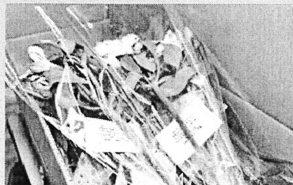
アルストロメリアの花言葉「未来への憧れ、持続」