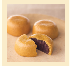
手作りお饅頭販売