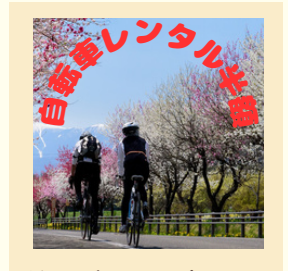
サイクルスタンド BM-FUJI