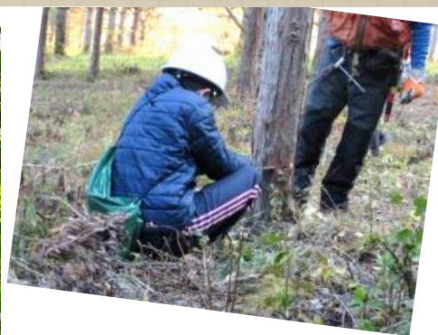
写真: 昨年の林業体験の様子