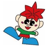
箕輪町イメージキャラクター もみちゃん