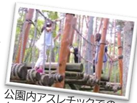
公園内アスレチックでの自由時間もあります♪