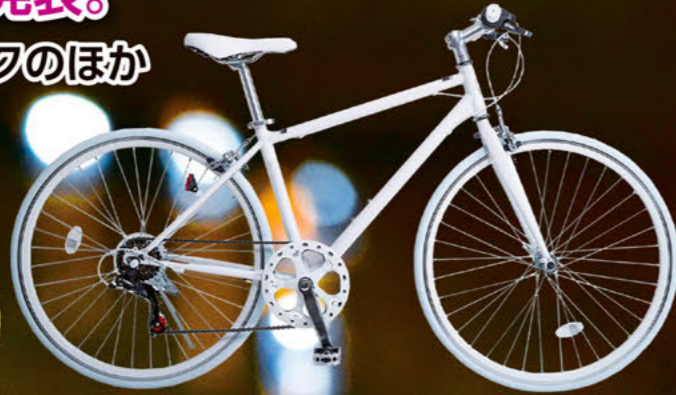
クロスバイク(自転車) ※画像はイメージです。