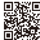
認証キーの取得方法 発注者への提出方法