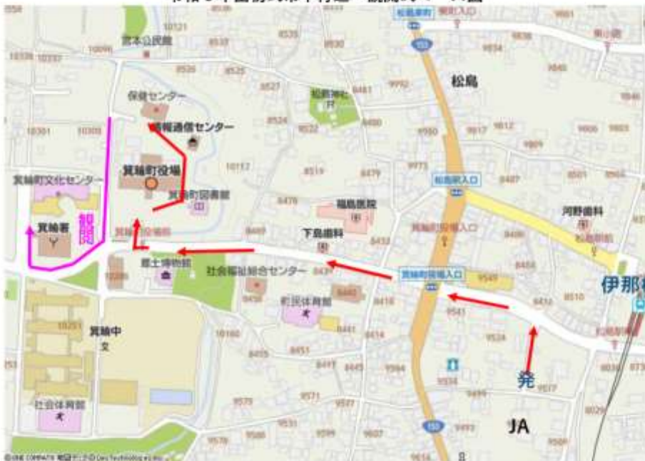
令和6年出初式市中行進・観閲式コース図