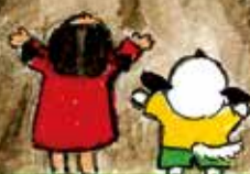
イラスト 森下 容子