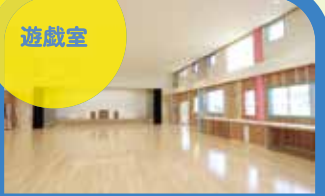
高く大きな窓がある明るい室内。未満児遊戯室も別にあります。