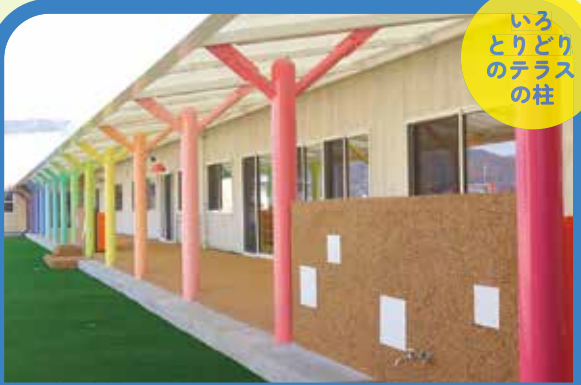
中庭を囲むテラスの柱。毎日このテラスからお部屋に入ります。「いろいろどり」が遊びの創造につながります。