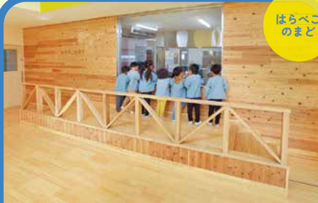
調理室の中を見渡せる大きな窓。園児たちは大きなお鍋や沢山の食材に興味津々。調理員さんと園児お互いの顔が見える双方コミュニケーションが食への興味関心をかきたて、食育の場へとつなげます。