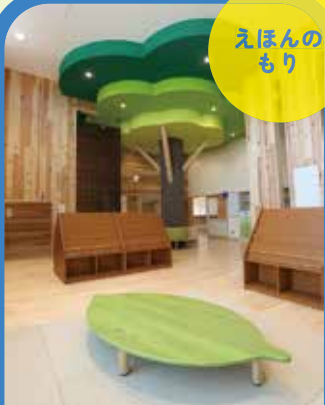
ケヤキのオブジェの下で絵本を読んだ記憶は大人になっても忘れないでしょう。園の名所です。