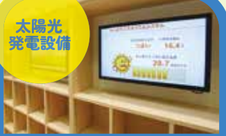
発電された量が園児たちにもわかるように掲示されています。