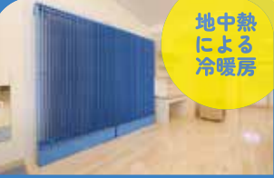
除湿型放射冷暖房パネルを使用。衛生的で感染症対策に有効です。