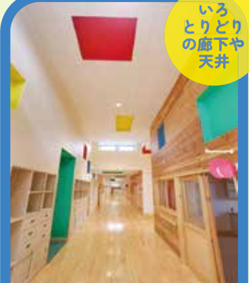
廊下・天井のいたるところで「いろいろどり」を表現しています。