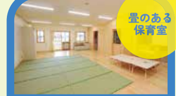
未満児以下の保育室には畳が敷かれています。