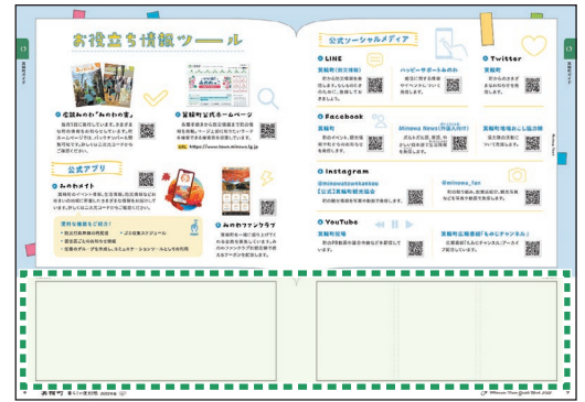
※デザインは実物と異なる場合がございます。