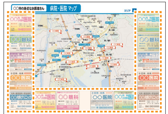
※記事は他地域の例です。