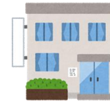
居宅介護支援事業所