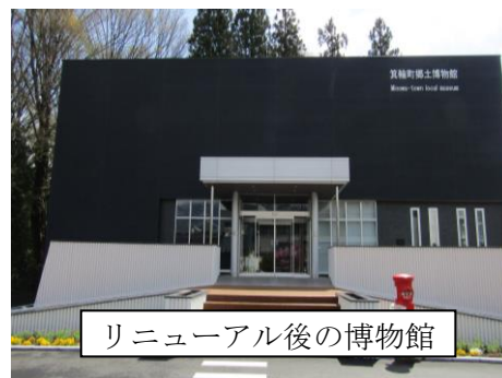
リニューアル後の博物館