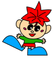
箕輪町イメージキャラクター「もみぢちゃん」