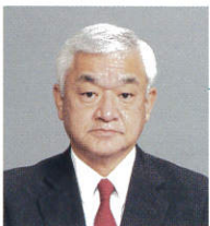
ふくだ5S実践舎 代表