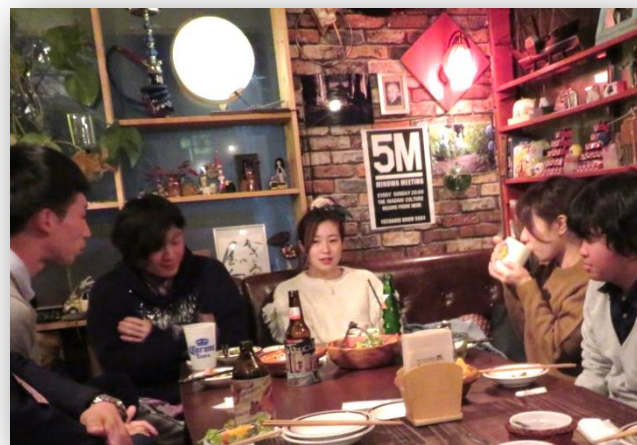
20代前半の男女5人からヒアリング