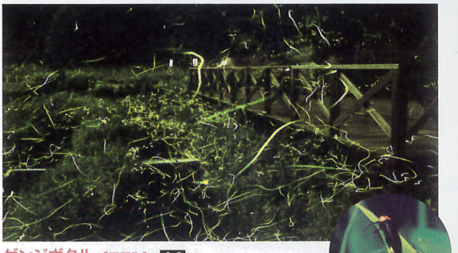
ゲンジボタル【辰野町】 A-2

樹齢1000年を超えるといわれ、県天然記念物に指定されたエドヒガン。樹高約15m、周囲6.7mの巨木の根元には権現さまが祀られていることから、権現桜とも呼ばれています。樹勢がよくととのい、やや小ぎめの花をいっぱい咲かせ、東西の枝で若干色味が違うなど、観る人を楽しませてくれます。