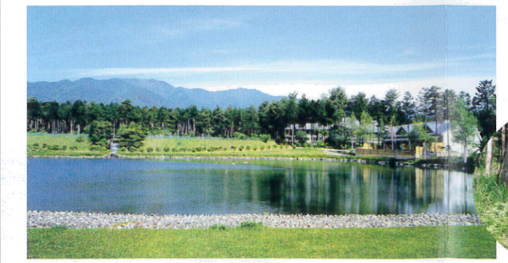
信州大芝高原【南箕輪村】 B-4

ヘブンリーブルーは、別名「天上の青」といわれる爽やかな空色が魅力的な西洋アサガオです。地域農家の有志グループによって大切に育てられ、多くの写真愛好家が訪れます。8月下旬～9月下旬