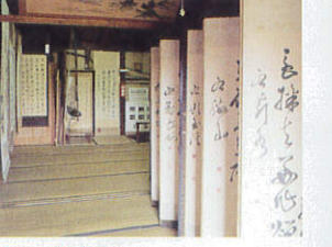
大宗館文庫資料【南箕輪村】 B-4

2つのアルプスを望む、2万3000坪の苑内に、4月～5月にかけて、紅梅、白梅、れんぎょう、しだれ桃、緑の桜が次々と鮮やかな美と香りの饗宴を楽しませてくれます。☎0265-79-4086