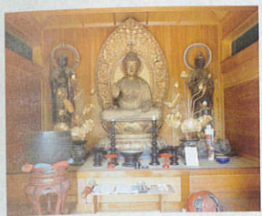
無量寺 阿弥陀如来座像