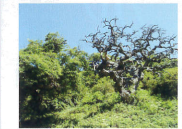
しだれ栗森林公園【辰野町】 B-1

中央アルプス経ヶ岳に源を発する清流と原始林が織りなす美しい渓谷。緑や紅葉など季節の彩りはもろろんのこと、川底を這うように横たわる奇岩、国指定天然記念物の「蛇石」、高さ50mの三級の滝など絶景奇景が見物。美しさと野趣が堪能できるスポットです。