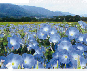
ヘブンリーブルーの畑【箕輪町】 B-3

湖畔には約1万本のもみじが植えられ、秋には美しい紅葉が楽しめます。周辺には公園や広場、キャンプ場もあり、上流は溪流釣りの好適地として知られています。10月下旬～11月上旬