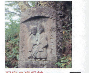
沢底の道祖神【辰野町】 A-2

美空ひばり芸能生活30周年記念曲「歌の里」は、詩の舞台になった伊那谷で誕生しました。生前をしのぶ貴重な資料が展示されています。☎0265-79-1601