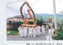
南小河内おさんやり