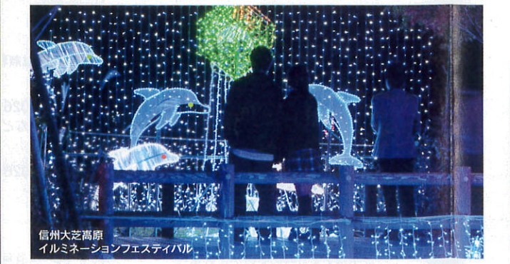
イルミネーション【辰野町・箕輪町・南箕輪村】

町のシンボルである大城山の北方、標高1,277mの鶴ヶ峰にあります。日本の屋根展望台からは南・北・中央アルプス、八ヶ岳連峰などの大パノラマが楽しめます。