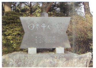
日本中心の標【辰野町】 B-1

長野県選択無形民俗文化財に指定されている古田人形芝居。江戸中期から上古田地区を中心に、風よけや豊作を祈る神への奉納として行われたと伝えられています。◎郷土博物館 ☎0265-79-4860