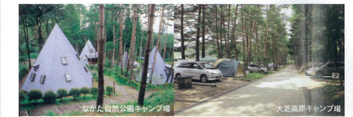
キャンプ【辰野町・箕輪町・南箕輪村】

9月下旬～10月上旬、日本では珍しい赤そばの花が、東京ドームほどもある広大な畑を彩ります。この赤そばは、ヒマラヤ原産の赤そばを持ち帰り品種改良した「高嶺ルビー2011」という希少品種。観て美しく、食べておいしいのが魅力。