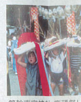
箕輪南宮神社 鹿頭祭り