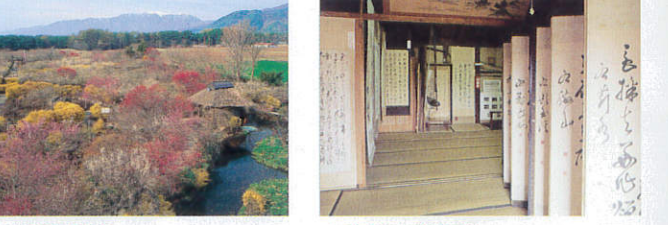
信州伊那梅苑【箕輪町】 B-3

永正2年(1505)の年号が刻まれ、今でも行き交う人々の守り神として鎮座する日本最古の道祖神。