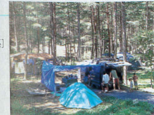
しだれ栗森林公園