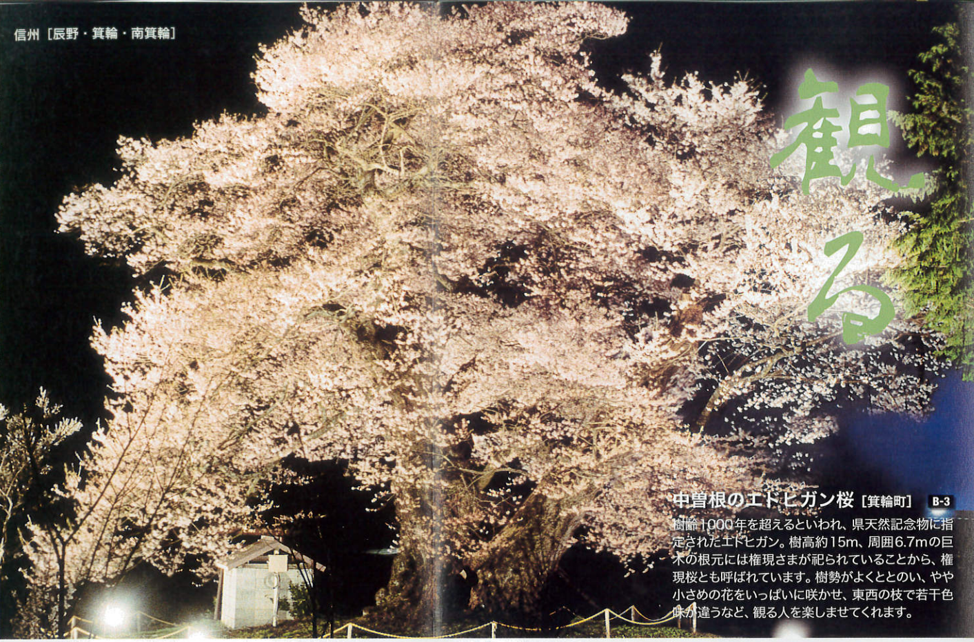
中曽根のエドヒガン桜【箕輪町】 B-3

樹齢1000年を超えるといわれ、県天然記念物に指定されたエドヒガン。樹高約15m、周囲6.7mの巨木の根元には権現さまが祀られていることから、権現桜とも呼ばれています。樹勢がよくととのい、やや小ぎめの花をいっぱい咲かせ、東西の枝で若干色味が違うなど、観る人を楽しませてくれます。