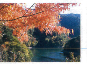
箕輪ダムもみじ湖【箕輪町】 A-3

自然豊かな伊那谷には、家族と、仲間と、のびのび過ごせるキャンプ場が点在しています。涼しい木陰で、広い芝の上で、清らかな流れの横で、満天の星空の下で...、キャンプ、オートキャンプ、バンガローなど思い思いのキャンプライフが待っています。