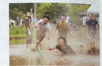
泥地フラッグス世界大会