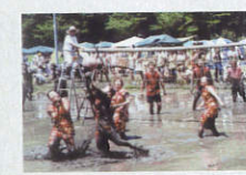
どろん田バレーボール日本大会