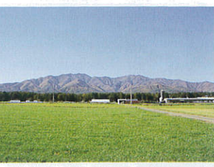
経ヶ岳【南箕輪村】 標高2,296m C-3

中央アルプスの最北端にあり、南箕輪村の飛地に位置する。木々が美しく、岩場が少ないため歩きやすく、登山コースとしても人気です。