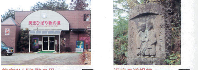
美空ひばり歌の里【箕輪町】 A-3

東日本随一といわれる松尾峡のゲンジボタル。町のシンボルでもあり、初夏には闇夜を彩る光の乱舞が、幻想的な世界を楽しませてくれます。ピーク期の6月中旬頃には、町をあげて「ぼたる祭り」が盛大に開催され、多くの人々に賑わいます。