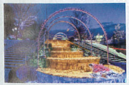
イルミネーションフェスタ☆みのわ