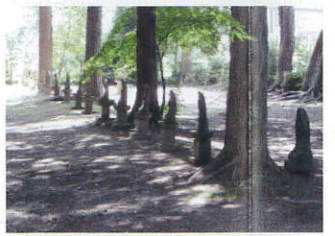
新四国霊場【南箕輪村】 B-4

伊那(三州)街道、初期中山道の宿町として栄えました。今でも街道沿いには歴史を感じさせる建物が保存され、往時の栄華と繁栄がしのべられます。