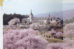
荒神山公園さくら祭り