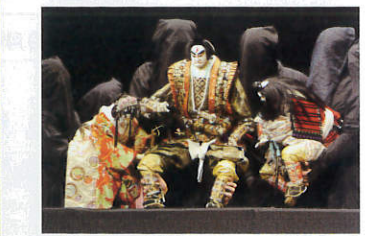
古田人形芝居【箕輪町】

松林寺裏の林中にあるお四国様。江戸時代に四国八十八カ寺の本尊を安置したもので、石仏群が老木の下に穏やかにたたずむ姿は、人々に安らぎを与えてくれます。