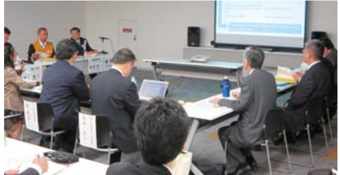
白熱した事前現地指導の様様

問合せ先 危機管理・セーフコミュニティ推進課 ☎79-3111(内線193・195)