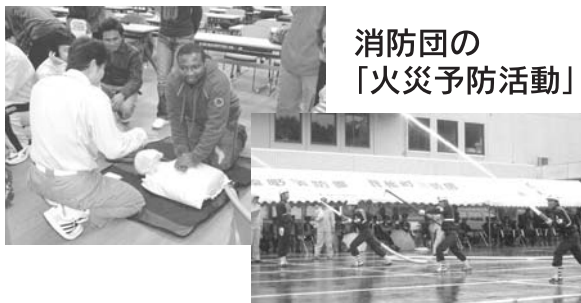
消防団の「火災予防活動」