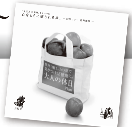
今回作成したパンフレット