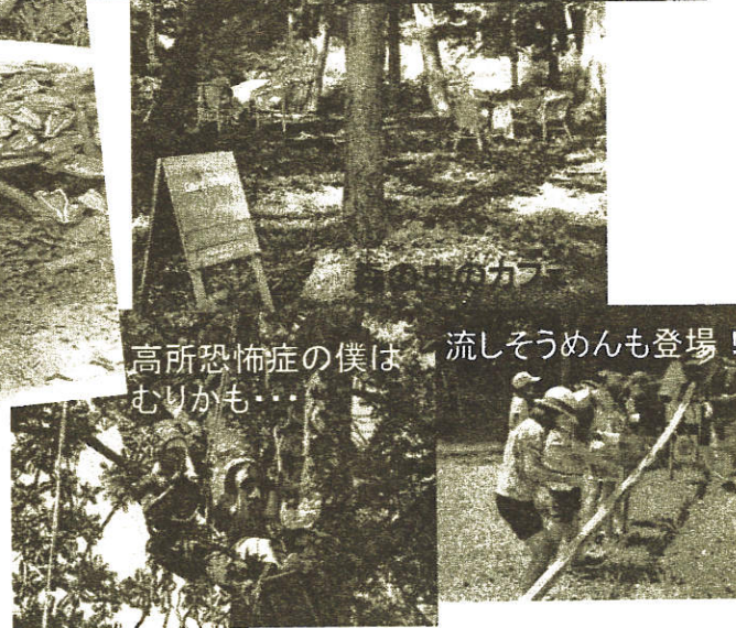
高所恐怖症の僕はむりかも...