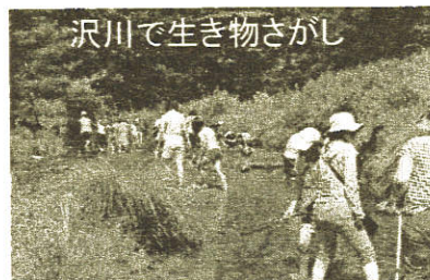
沢川で生き物さがし

役場や商工会の有志の方に盛り上げていただき、勝手に手ごたえを感じています(笑)「よいしょ！よいしょー！」の声に、どこからともなく町のお父さん、お母さん、ちびっこが集まってきて「者はよくやったね」「はっかしいね、こうすると上手にできるよー」一斉にいつにこり工場に... 沢山の人の笑顔が見られる楽しい時間になりました。またいつか登場しますので、お楽しみに！