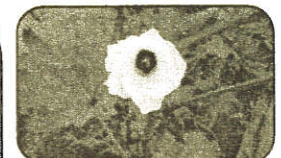
<ズッキーニの花と実>