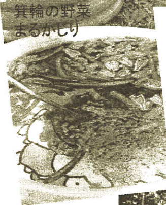
箕輪の野菜まるかじり