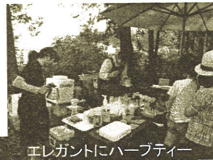
エレガントにハーブティー