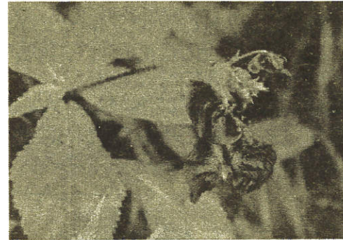
← 舟をつるしたような 花のツリフネソウ