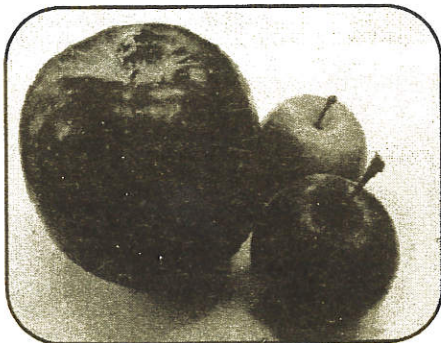
左：秋映 右：メイポール

『メイポール』は、姫りんごのようなサイズの実がなり、果肉の部分も赤くてかわいらしいのですが、酸味が強くて渋みがあり、甘みが少ないので生食には適さない品種です。枝を上には伸ばすので、その樹形から、バレリーナツリーとも言われているそうです。