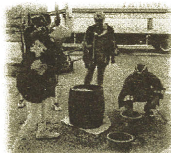
ギネス更新祈願の餅つき 長岡のナガノパープルとシャインマスカット