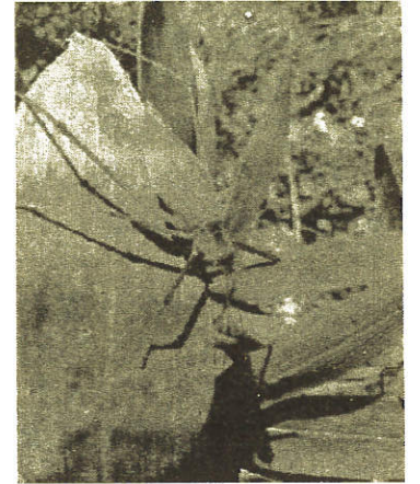
↑ 童謡でおなじみの マツムシ

調査の中で、かなり貴重な蝶類や 植物類も見つかっています。今は、写真 を撮りためる作業が中心ですが、3年後 をめどに完成させる方向で進んでおり ますので、お楽しみに!!